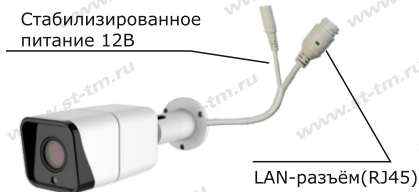
Рис. 1 Схема подключения видеокамеры