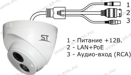
Рис.1 Схема подключения видеокамеры